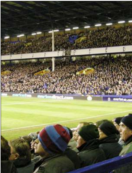
Kühle Sitzplatzkultur in Everton.