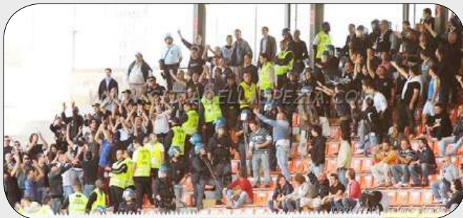
In La Spezia standen die Comaschis direkt neben den Heimfans im Block.

italienischen Ultra-Tradition den Todesstoss zu versetzen. Denn das Beispiel England hat Anfang der 1990er Jahren bereits erschreckend gezeigt, wie eine jahrzehntelange Fankultur durch einige Law & Order-Extremisten innert kurzer Zeit aus den Stadien verschwinden kann.