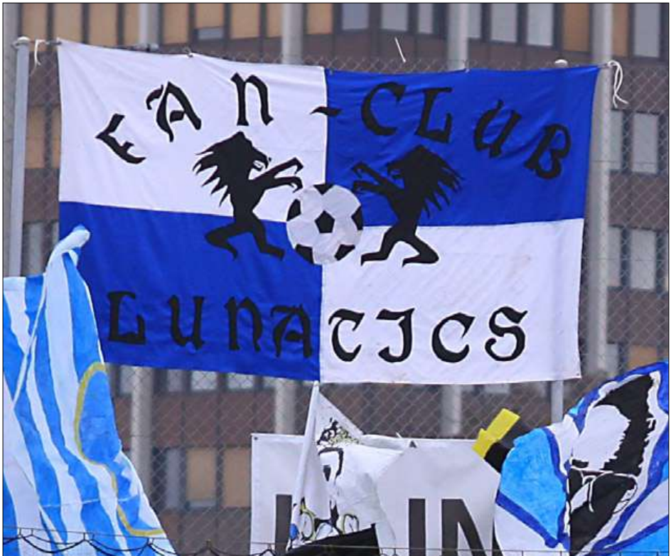
Die Lunatic-Zaunfahne hoch über der Zone 2.

ver Fan“ wächst nämlich bei den meisten von uns. Doch werden wir denn wirklich alle zusammensitzen können? Mit grosser Sicherheit wird das neue Stadion ein absoluter Hexenkessel, denn die steilen Rampen mit den Sitz- und Stehplätzen sind sehr nah am Geschehen, und das umschlossene Dach wird unsere lautstarken Gesänge noch verstärken. Wir freuen uns auf einen heissen Frühling in der Rückrunde - wer weiss, was in Luzern abgeht, wenn der FCL zum zweiten Mal in der Klubgeschichte den Meistertitel in die Höhe stemmen kann? Die LUNATICS sind auf jeden Fall allzeit bereit dafür. LONG LIVE LUNATICS!