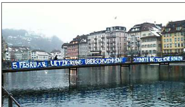
Luzern in Euphorie vor dem Rückrundenstart.