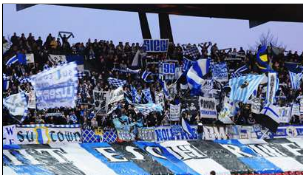
22 Jahre sind zu lang: «D Zitt esch riif!»