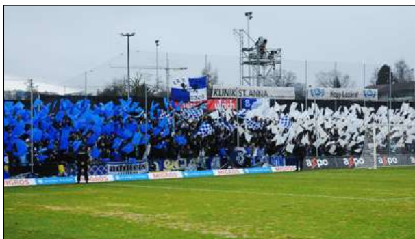
Die Zone 2 erstrahlt gegen Basel in blau-weissem Fahnenmeer.