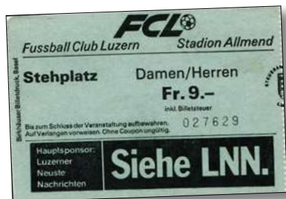
Eintrittsbillet aus der Saison 1983/1984.

licher Sektoren mittels des sogenannten „Sicherheitszweifränklers“ zur Kasse gebeten.