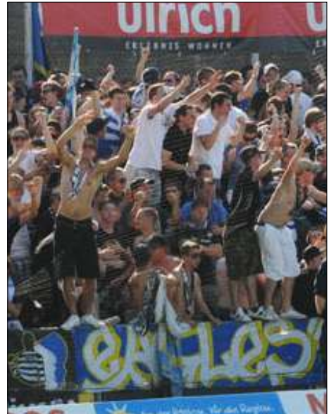
Ausgelassene Stimmung im Gersag.