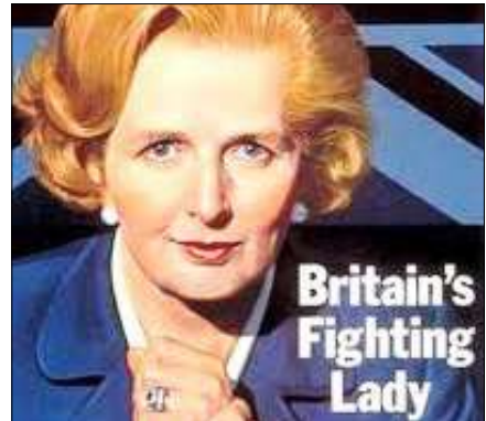
Margaret Thatcher reigned with an iron fist.

As a direct result of Heysel UEFA, fed up with British hooligans behaviour, decided to act fast and act swift. They banned English clubs from competing in European competition for an indefinite period of time. We also had a fire at Bradford City in 1985. Bradford were supposed to celebrate winning the Third Division yet instead