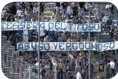
Protest gegen die Fankarte.

Wir, die Supporter von Como, haben darum entschieden, dass wir diese Dummheit nicht